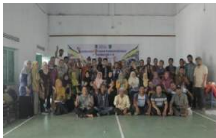
Gambar 4. Program Pengabdian Masyarakat Desa Jeblog-Klaten

Secara umum, luaran dari kegiatan penyuluhan dan pendampingan tata kelola organisasi desa yang efektif berjalan dengan lancar, tidak ada kendala yang berarti. Luaran kegiatan ini adalah pihak perangkat desa dan pengelola BUMDes menjadi belajar untuk mengidentifikasi permasalahan yang menghambat kinerja organisasi dan berpikir secara mandiri serta sistematis menemukan alternatif solusi yang tepat. Unsur terpenting dari kegiatan pengabdian masyarakat ini adalah upaya memandirikan dan memberdayakan elemen dan perangkat desa sedemikian rupa sehingga pihak desa akan selalu menemukan cara mengembangkan potensi yang menjadi tujuannya meskipun intervensi program pengabdian dari kampus secara riil tidak berlanjut kembali di masa mendatang [11]. Metode pengabdian berupa penyuluhan dan disertai dengan pendampingan terbukti cukup efektif memunculkan keterlibatan perangkat desa dan pengelola BUMDes untuk secara aktif memperbaiki dan berkontribusi terhadap kurangnya praktik pengelolaan manajemen desa selama ini.