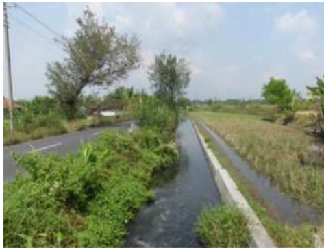
Gambar 1. Aliran Air Jernih Selokan dan Sungai

Melalui analisis secara singkat mengenai gambaran kondisi dan pemetaan permasalahan di Desa Jeblog, penulis berupaya di dalam tahapan perwujudan Desa Jeblog sebagai desa wisata ikan Nila terutama pada aspek manajemen dan pengelolaan pemerintahan desa dan BUMDes yang efektif dan berorientasi layanan kepada masyarakat desa. Secara sistematis, penyuluhan dan pendampingan yang diberikan merupakan implementasi secara sederhana dari konsep Good Corporate Governance (GCG) atau Tata Kelola Organisasi yang baik namun diadaptasi ke dalam konteks pengelolaan pemerintahan desa dan organisasi BUMDes [5]. Prinsip-prinsip Good Corporate Governance secara umum meliputi transparansi, akuntabilitas, responsibilitas, independensi, dan fairness atau keadilan [6].