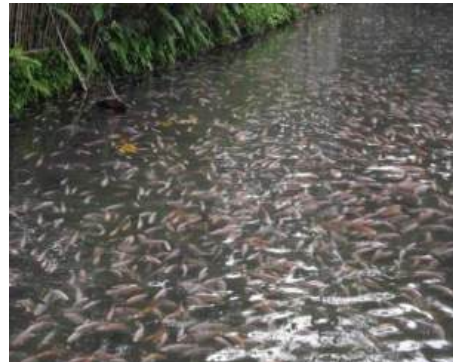
Gambar 2. Panen Raya Nilai Mencapai 3 Ton