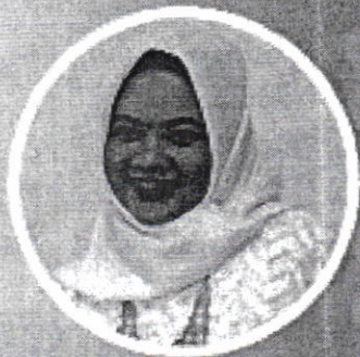
ndi Adityaning Palupi n Direktur Bank Indonesia DIY